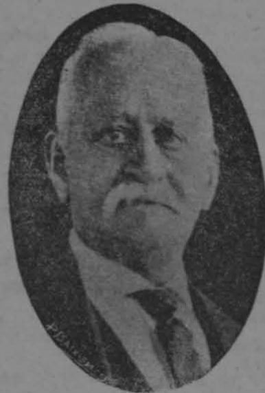
Mr. Minor C. Keith Quien financió la instalación de la primera planta eléctrica en Costa Rica

Se nos informa que las primeras lámparas estaban colocadas así: esquina Sur del actual edificio de correos, esquina del hoy edificio del Banco Internacional, frente de la actual Comandancia de Plaza, en aque-